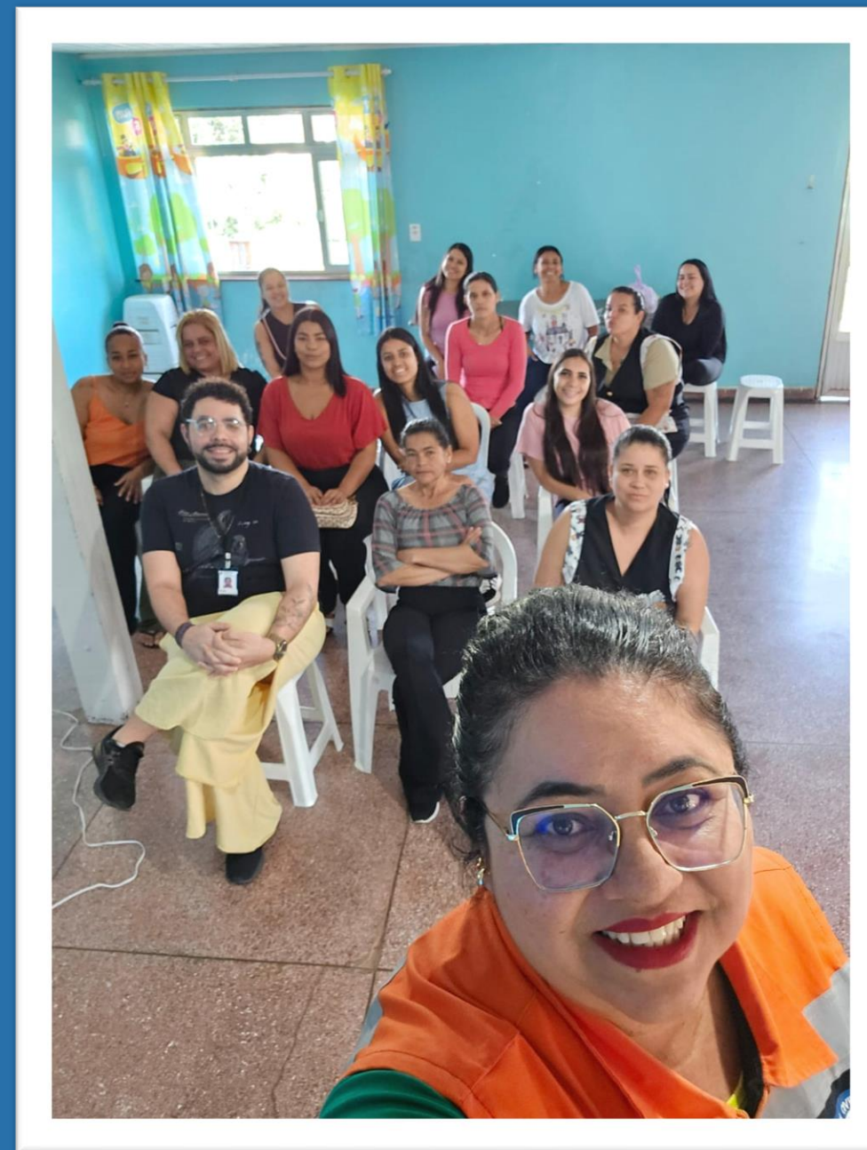
Núcleo de Proteção e Defesa Civil (Nupdec) - Instituto Viva Vida Agosto/2024