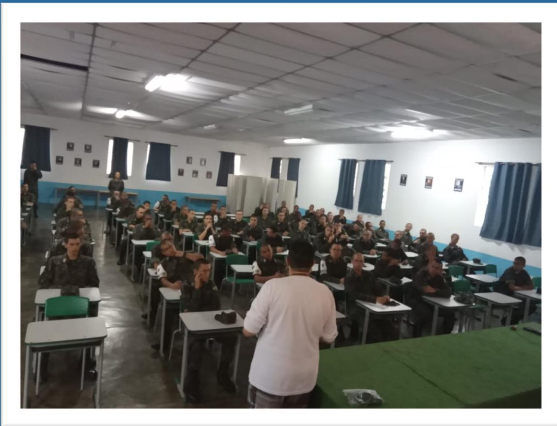
Núcleo de Proteção e Defesa Civil (Nupdec) - Tiro de Guerra Agosto/2024