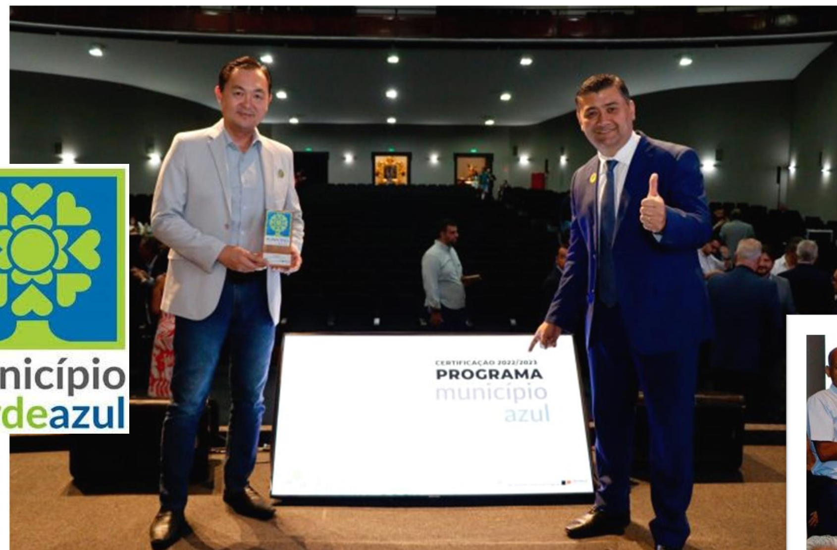
Certificação Programa Município VerdeAzul Palácio dos Bandeirantes - Dezembro/2023