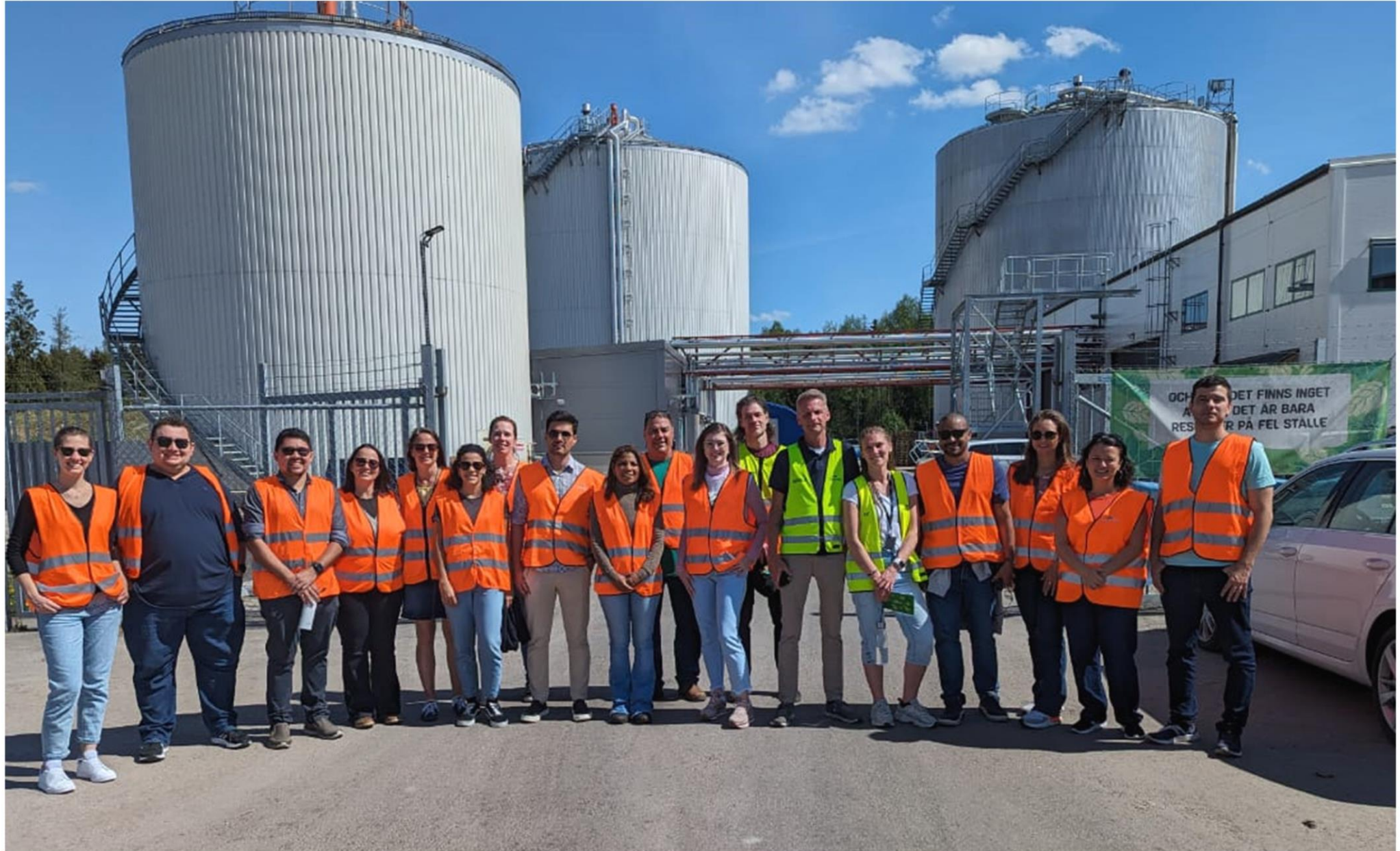
Västerås – Suécia Maio/2024

Associação Brasileira de Resíduos e Meio Ambiente (ABREMA) em parceria com a consultoria Milav e a Agência de Proteção Ambiental da Suécia (SEPA)