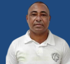
Ver. Baiano da Saúde